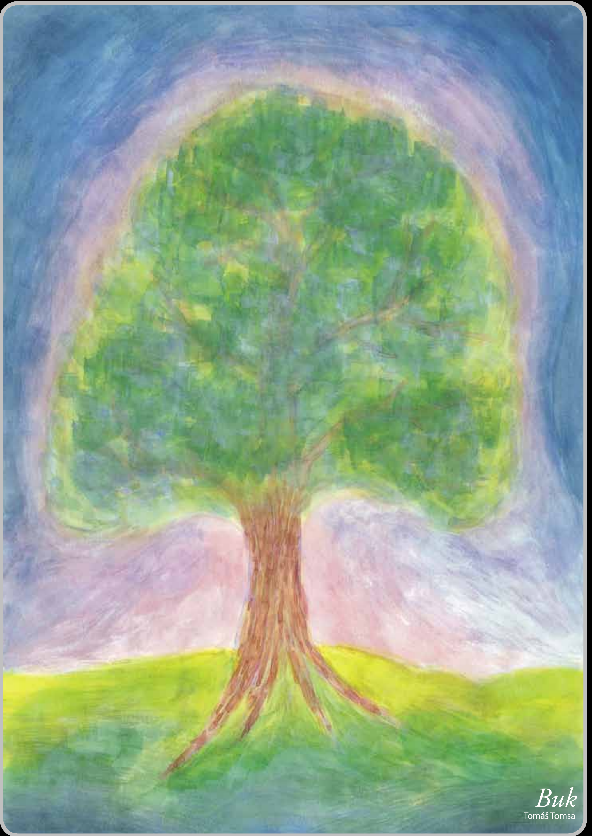
Buk Tomáš Tomsa